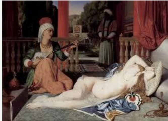
L'odalisca e la schiava del 1839 Ingres oppure Il bagno turco

Se già nel '600 l'abitante di terre esotiche e lontane diventò oggetto di desiderio e le opere che lo ritraevano individuavano il proprietario, non solo come un uomo colto e illuminato, ma anche veramente ricco, due secoli dopo l'oriente, agli occhi di un europeo, rappresentava l'evasione verso mondi esotici dove tutto era concesso.