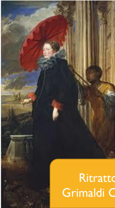
Ritratto della Marchesa Elena Grimaldi Cattaneo 1623 di Van Dick